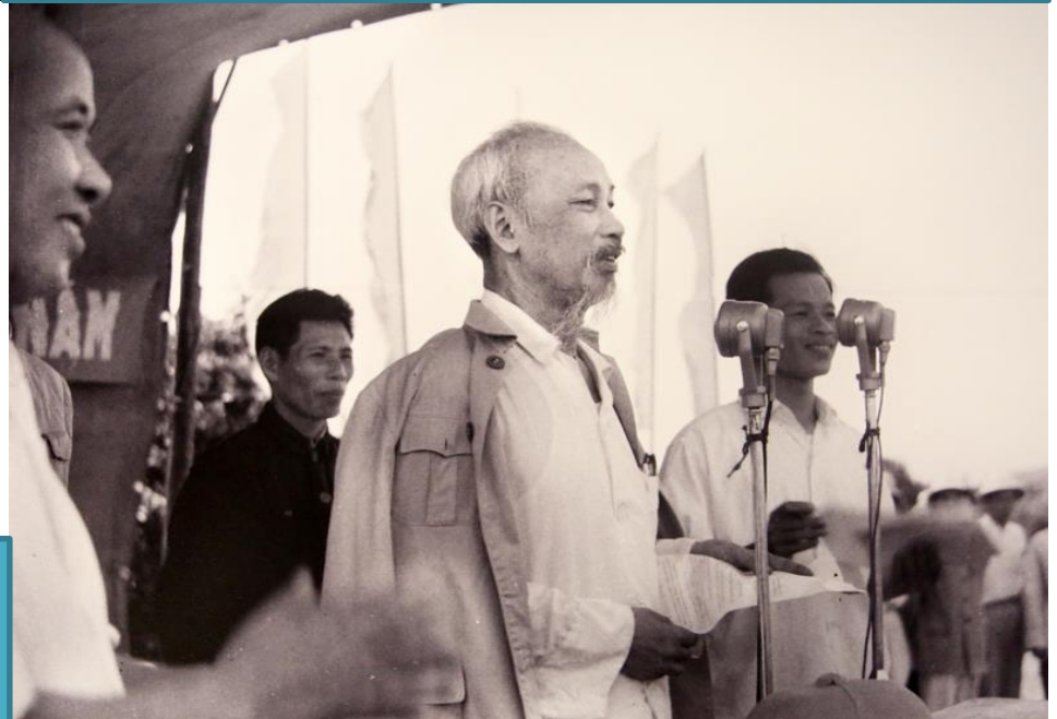
Chủ tịch Hồ Chí Minh nói chuyện với nhân dân Cô Tô trong buổi mít tinh chào mừng Người.