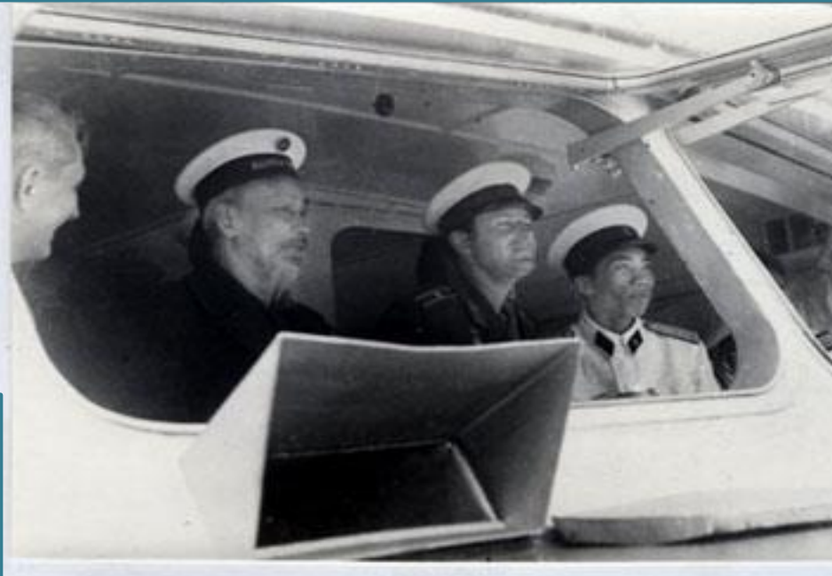
Trong chuyến thăm vịnh Hạ Long, Bác đã đặt tên cho hòn đảo số 47 trên hải đồ Hạ Long là “Đảo Ti-tốp”. Ảnh tư liệu