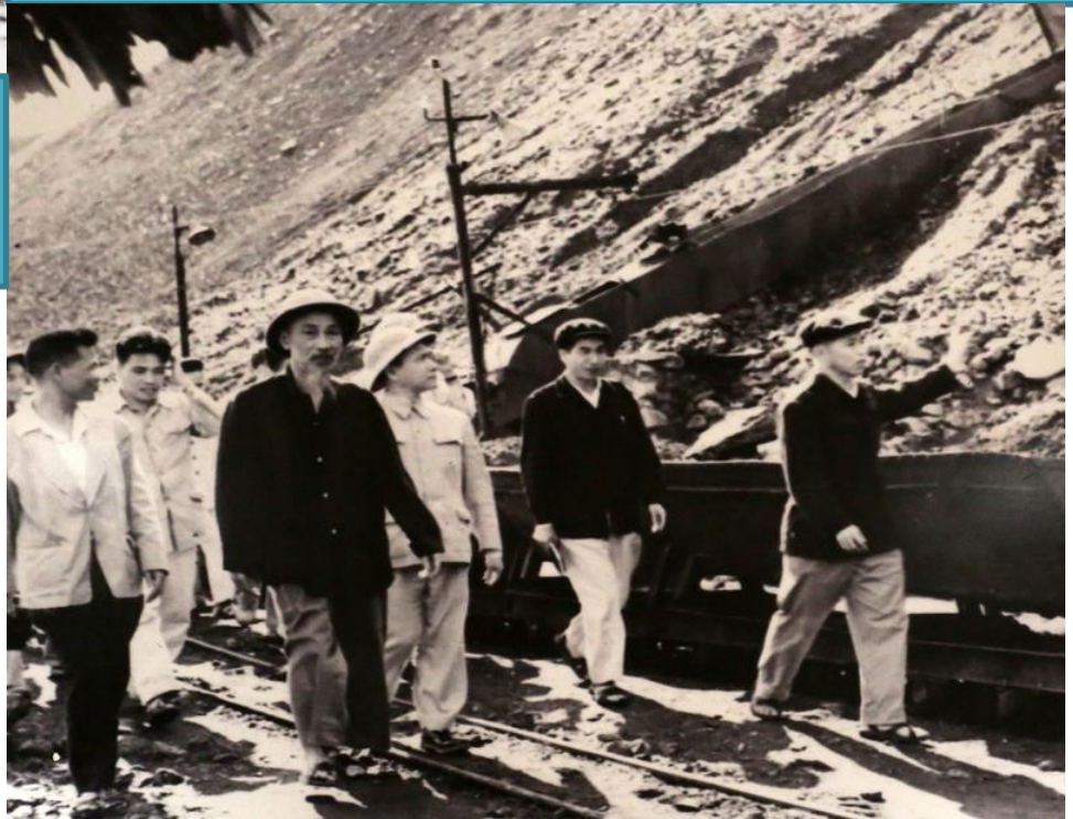
Trong chuyến đi lần này, Chủ tịch Hồ Chí Minh đã đến thăm mỏ Đèo Nai.