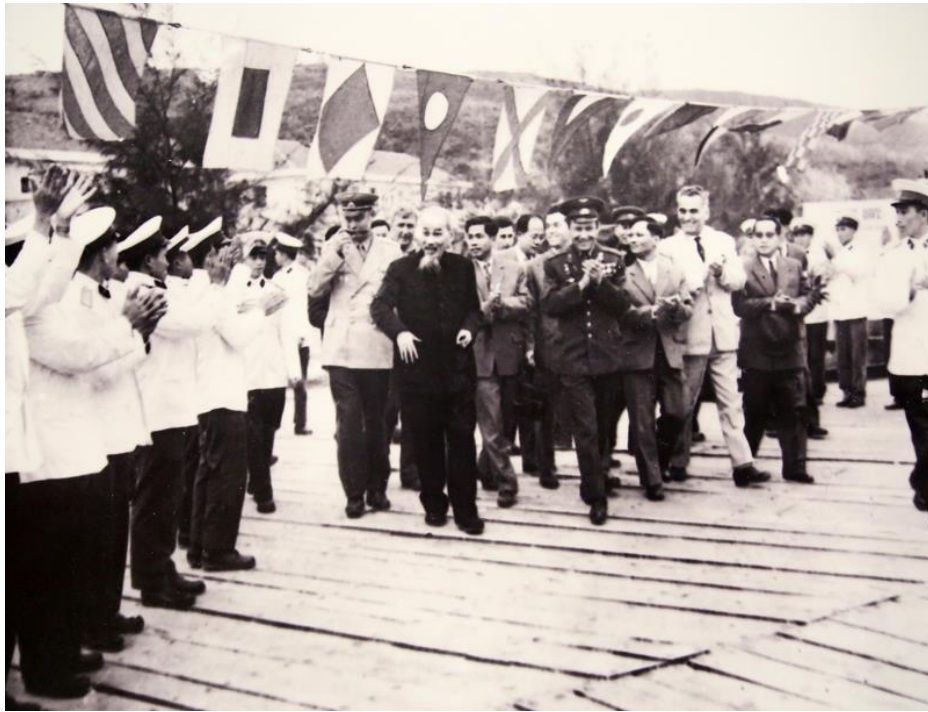
Chủ tịch Hồ Chí Minh và Anh hùng vũ trụ Liên Xô Ghéc-man Ti-Tốp thăm vịnh Hạ Long, ngày 22/1/1962.