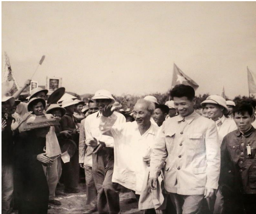
Nhân dân đảo Cô Tô đón Bác ra thăm đảo, ngày 9/5/1961. Ảnh tư liệu