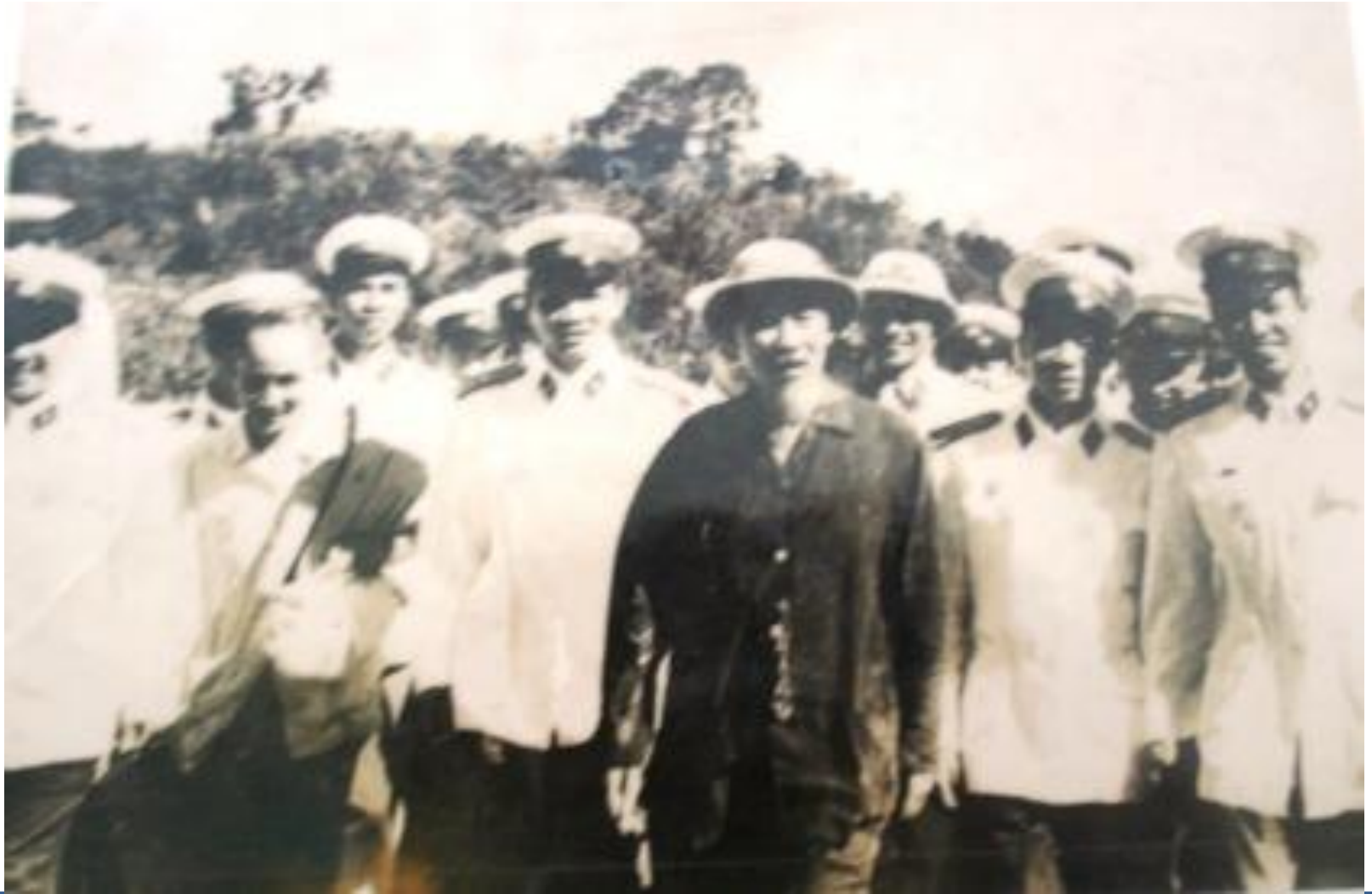
Bác Hồ thăm Bộ đội Hải quân tại đảo Vạn Hoa (Quảng Ninh), năm 1962.