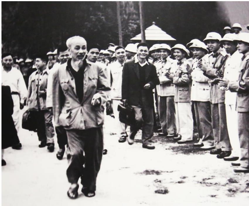
Trong lần thứ ba về thăm Quảng Ninh, Chủ tịch Hồ Chí Minh thăm đảo Hòn Rồng, một căn cứ của bộ đội hải quân ở Quảng Yên (ngày 31/3/1959).