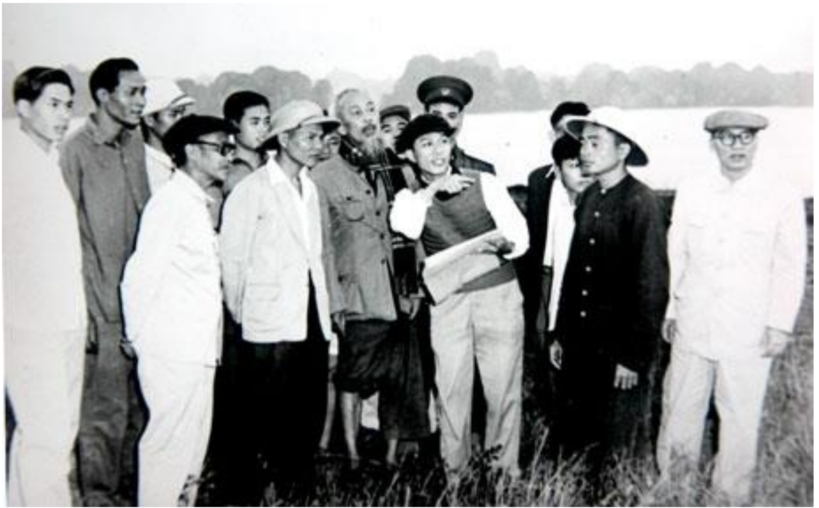
Bác Hồ thăm và nói chuyện với nhân dân đảo Tuần Châu ngày 23-11-1963.