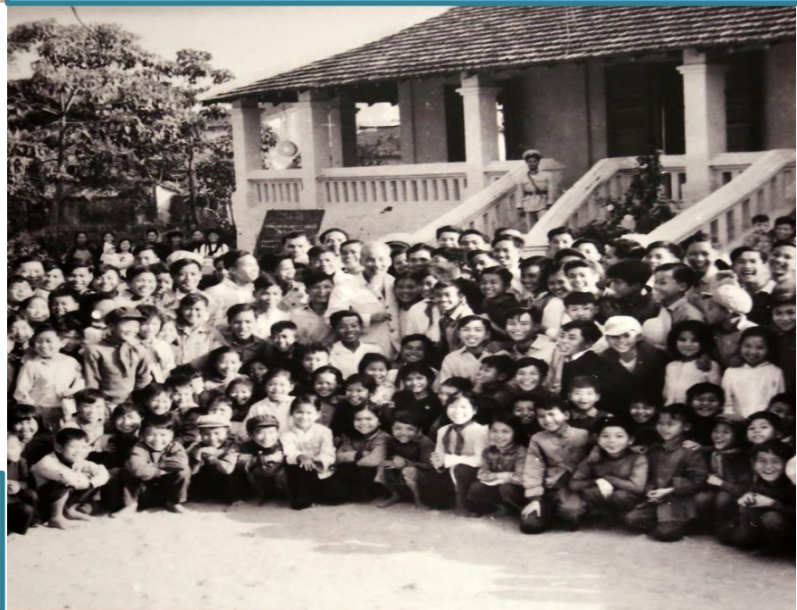
Bác đã chụp ảnh lưu niệm với giáo viên, học sinh trường Lê Văn Tám, thị xã Móng Cái. Ảnh tư liệu