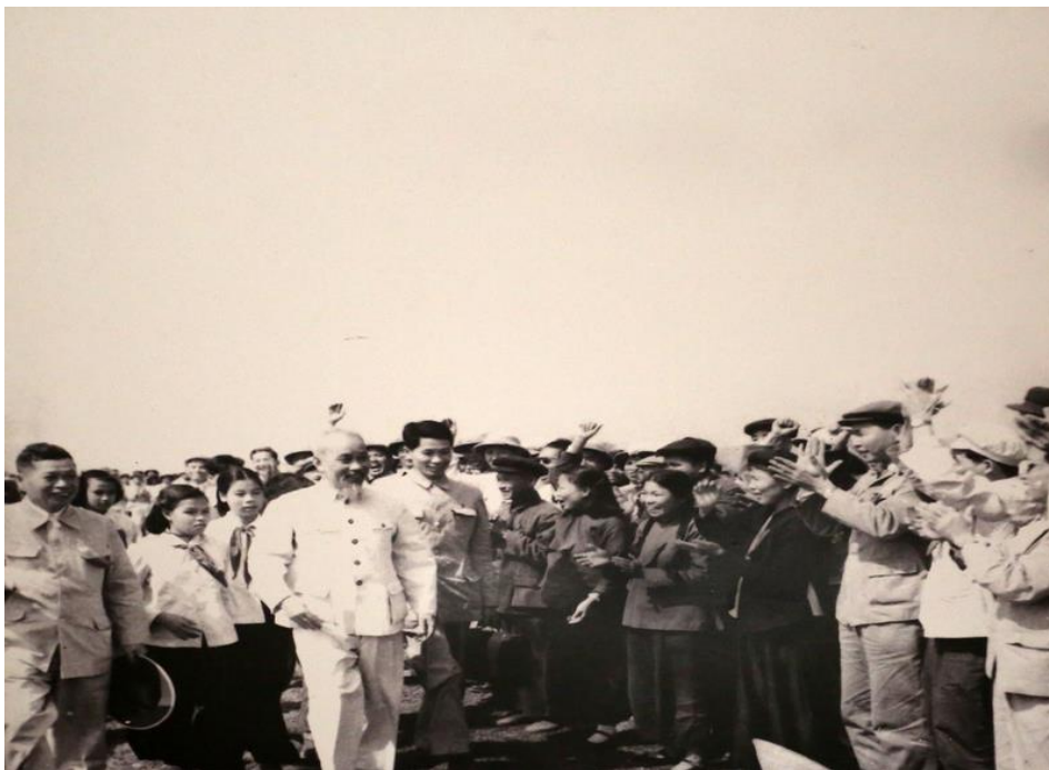
Nhân dân tỉnh Hải Ninh vui mừng chào đón Chủ tịch Hồ Chí Minh về thăm, ngày 18 và 19/2/1960.